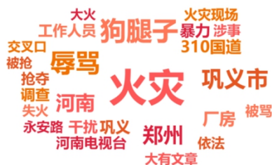
图3：“记者报道火灾被抢手机辱骂”事件词云图

在整体舆情信息的媒体渠道分布中，由于事件信息最初由河南都市报道官方微博账号发布，微博成为网民讨论主阵地，占比超六成。